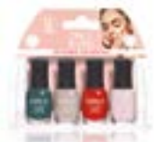
MINI KIT 4 UNIDADES Item #28903 Nuevos colores Item #28968