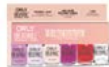
PACK 6 UNIDADES Incluye 6 Colores Breathable Item #25907 Item #25909 Nuevos colores - Item #25919