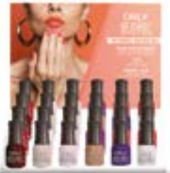
EXPOSITOR 24 UNIDADES MINI Item #21909