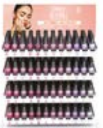
EXPOSITOR 144 UNIDADES Incluye 48 filas con 3 unidades de cada uno de los 36 colores Breathable + Expositor Item #21909