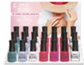
EXPOSITOR 21 UNIDADES Incluye 1 esmalte de cada color Breathable 18 en total, más 3 botellas de Brillo más Tratamiento y Expositor Item #25917 Nuevos colores - Item #25910