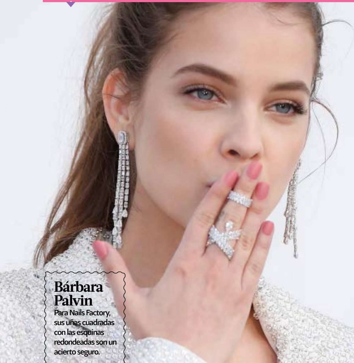
Bárbara Palvin Para Nails Factory, sus uñas cuadradas con las esquinas redondeadas son un acierto seguro.